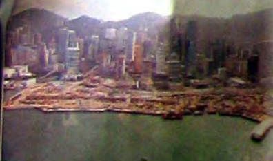
維多利亞港水深海闊，很適合玩帆船。

司徒醫生說喜歡玩帆船的人，生在香港真的好幸福，因為氣候及地理都很適合玩帆船：「維多利亞港名副其實水深海闊，最少都有 10 米深，而香港的秋冬亦比歐洲國家溫暖得多，又夠大風，可達 8 至 15 哩，夏天雖然風較細，不過也有 4 至 8 哩，可以慢慢航行。」