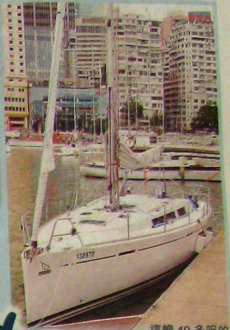
這艘 40 多呎的帆船，就是醫生的參賽戰船。