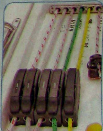
繩索之間有扣子，用來定位，非常重要。