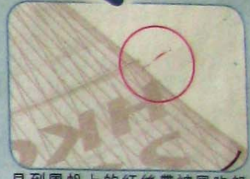
見到風帆上的紅絲帶被風吹起成 90 度直角，就是食風了！