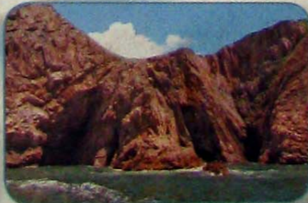
果洲群島是香港地質公園之一，揸帆船遊船河之餘，還可欣賞風景。

職業選手不多，大部分都是業餘身份，有正職在身，參加帆船比賽前需要時間適應合作及參與訓練，但大部分假期都會有節目或要陪家人，而實際參賽有時要花上幾天至一個星期，不是人人都可以抽時間這樣做。」