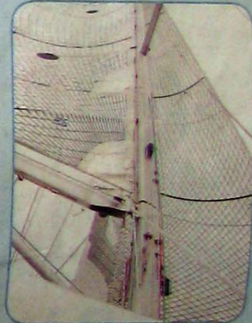
帆船主幹有幾層樓咁高，難怪可以起動一艘船。