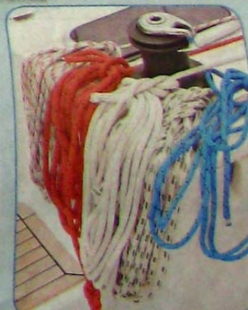
見到醫生船上的起帆繩索咁整齊，就知道做足準備工夫。